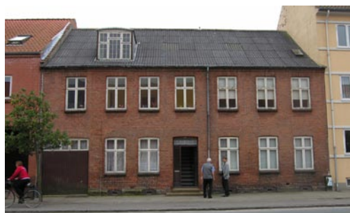
Ejendom i Viborg, opført 1882, ombygget 1924, hjemtaget 2006.