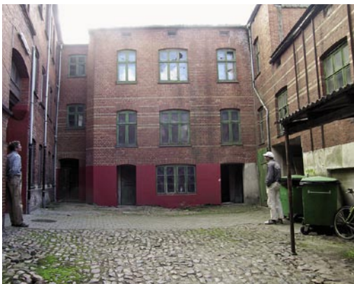
Baghuse Horsens, 1906 & 1916, hjemtaget 2005.

Den Gamle By skal til den lukkede karré bruge fire hjørnehuse, med de to første typer som første prioritet.