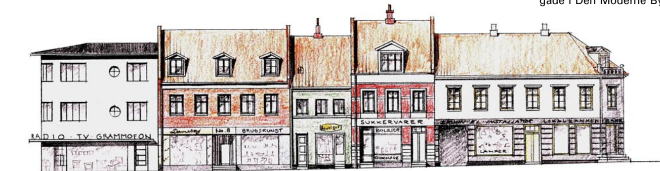
Den Gamle Bys tegnestues bud på Sønderbrogade i Den Moderne By.